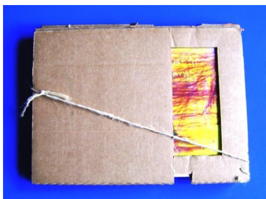
Figura 1 – Portfólio nº1 (posição: fechado) contendo trabalhos de alunos do ensino fundamental (2000) produzido pela professora-pesquisadora.

Com o objetivo de coletar dados referentes à produção de meus alunos, realizando diagnósticos de suas aprendizagens, construí portfólios que continham desenhos, colagens, recortes e pinturas relativos a um determinado período do ano letivo ou concernentes à determinadas práticas educativas que produziram processos semelhantes.