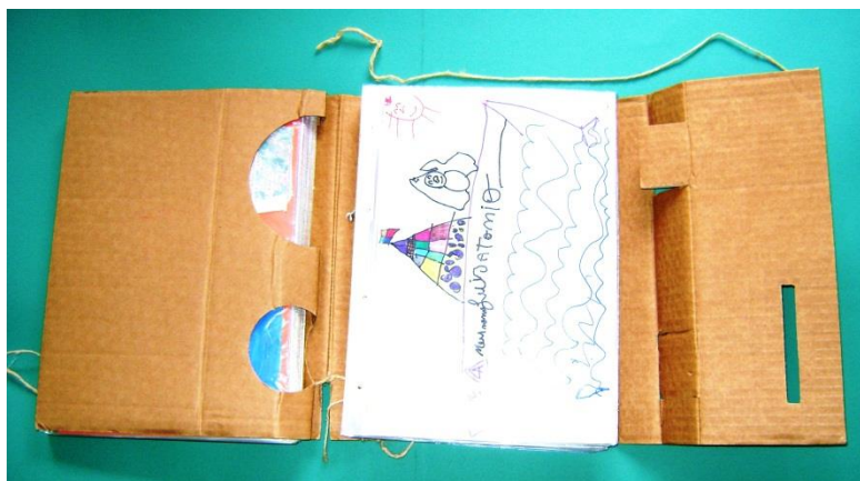
Figura 4 – Portfólio nº2 (posição: aberto) contendo trabalhos de alunos do ensino fundamental (2000) produzido pela professora-pesquisadora.