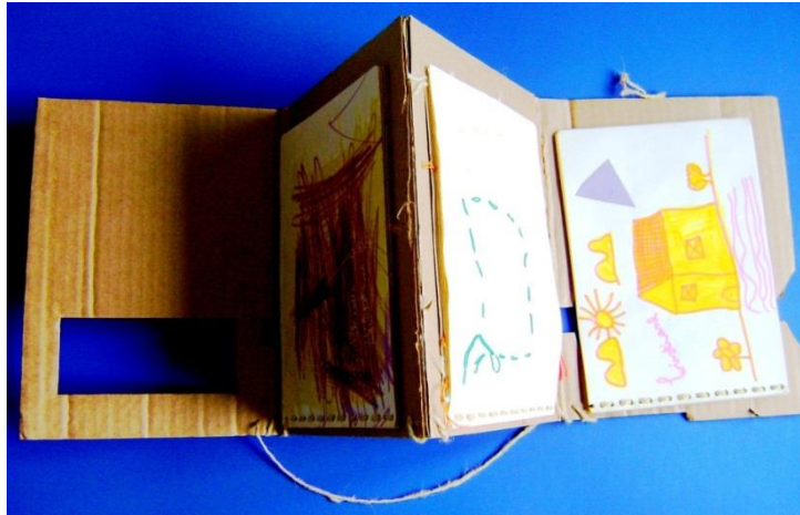
Figura 2 – Portfólio nº1 (posição: aberto) contendo trabalhos de alunos do ensino fundamental (2000) produzido pela professora-pesquisadora.