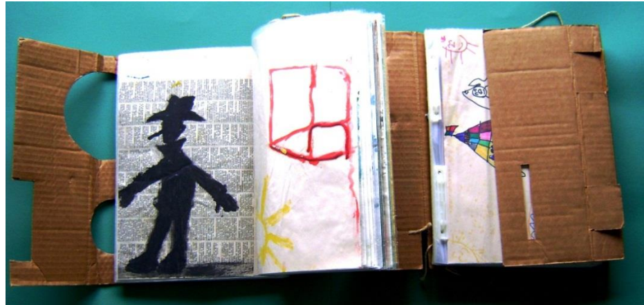
Figura 5 – Portfólio nº2 (posição: aberto) contendo trabalhos de alunos do ensino fundamental (2000) produzido pela professora-pesquisadora.

Segundo a minha experiência, o portfólio consistia em um documento, um registro de minhas práticas pedagógicas em Artes Visuais, junto aos alunos, que continha elementos que pudessem servir para reflexões futuras a respeito das minhas práticas docentes e do processo artístico dos alunos. O portfólio colaborava na minha formação continuada, possibilitando a recordação e a reflexão sobre meus fazeres docentes, evidenciando os conhecimentos e os saberes produzidos em sala de aula. Além disso, estes portfólios representavam um pouco da minha trajetória em cada turma, e me permitia recordar as atividades realizadas, refazer propostas e ter um material que promovesse a minha pesquisa como professora.